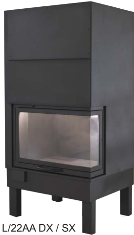
L/22AA DX / SX